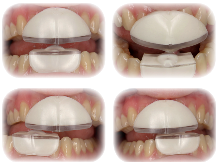
Fig. 3 : L'assemblage du TMJIG facilite les exercices, les repères permettent de visualiser les progrès.