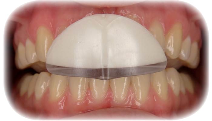
Fig. 1 : Le TMJIG « haut » : pose immédiate au cabinet pour la gestion de la douleur ou des limitations d'ouvertures buccales. Il se porte la nuit.

Il est destiné à réduire la douleur et la limitation de l'ouverture.