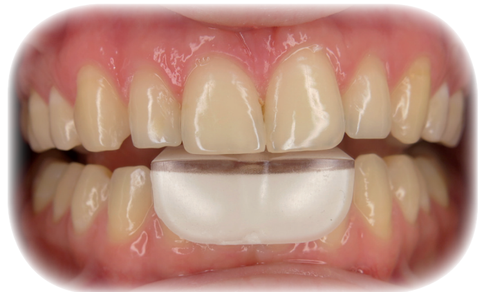
Fig. 2 : Le TMJIG « bas » est porté dans la journée.

Le TMJIG «bas» : Discret, il se porte le jour, au moment où apparaissent les douleurs. Il prévient le serrement excessif la journée. Lorsque vous le portez ; son contact vous fait prendre conscience du serrement : étirez en ouvrant votre mâchoire régulièrement, sans provoquer de douleur.